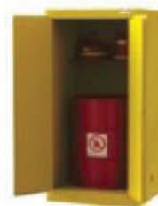
縦置き 55 ガロン (208L)