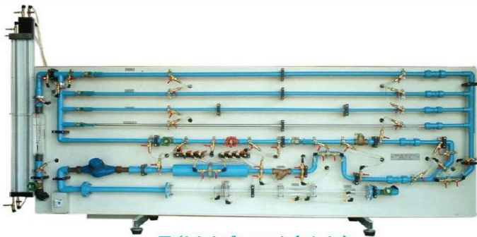
写真はオプションを含みます。

摩擦損失は圧力低下で、また吐出係数は圧力低下及び流量で計測されます。流量は水道メーター及びストップウォッチで計測され、圧力損失はマンノメーターを使用して差圧によって計測されます。圧力取出口はワンタッチ式の小型のボール弁です。全ての圧力取出口はフレキシブルホースで特別に配置された分岐管に接続され構成品の差圧はただ弁を開けるだけで、ホースを取り外す事なく計測されます。装置は水平調節器付きの脚が装着されています。