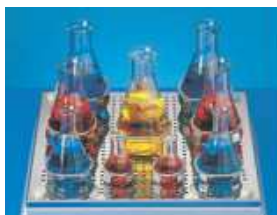
フラスコ固定器具