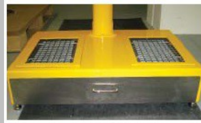
閉口時 両足測定器/収納引出し