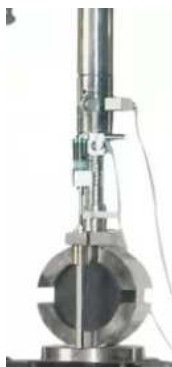
マーシャル安定度試験用