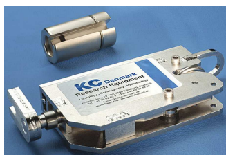
ナンセン式リリース器具