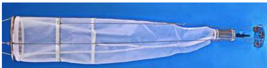
WP-2 プランクトンネット