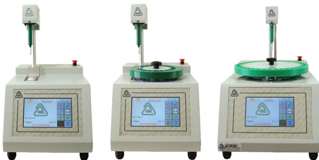
OsmoTouch 1 (OSK40BU201) 1 試験管モデル