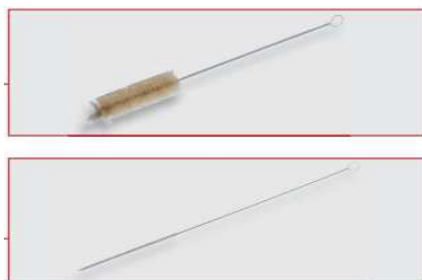
乳脂計洗浄用ブラシ (本体・頸部用)