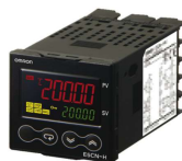
プログラム温度調節器 0.1℃単位表示 OMRON E5CN-H (48x48mm) オプション