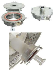
水冷式ガスタイトシールの例 (オプション)