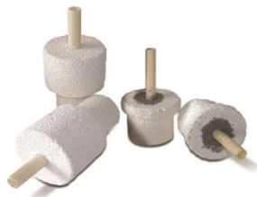
断熱セラミック製プラグ 標準アクセサリ 両端(炉心管長さ・内径に応じ て製作します)