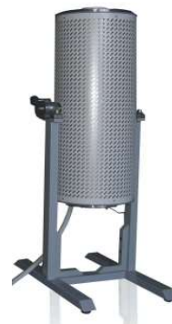
ユニバーサルスタンド (縦・横対応)