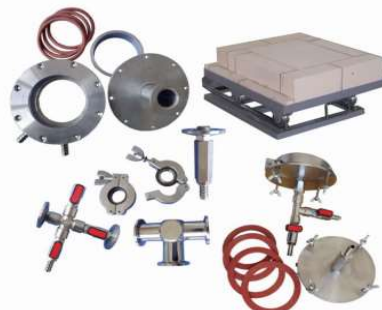
ガスタイトシール・フランジは、 形状・用途によりカスタマイズに応じます。