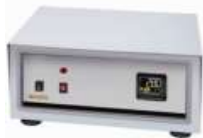
コンパクト制御ユニット (縦型の場合標準) (横型の場合はオプション) 写真中の制御器はE5CCを搭載して います。