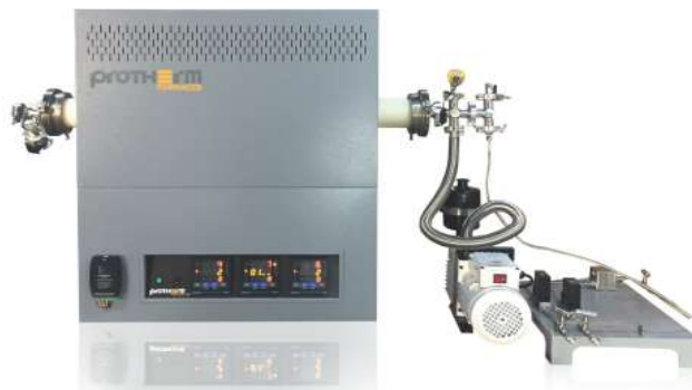
真空フランジの構成例 写真はオプションの3ゾーン制御