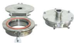
クイックロック式水冷真空フランジ (オプション)