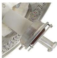
固定式水冷真空フランジ (オプション)