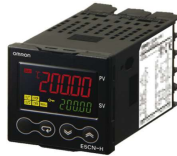
プログラム温度調節器・ 0.1°C単位表示 OMRON E5CN-H (48x48mm)オプション