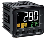
定値温度調節器・ 過熱防止制御器OMRON E5C (48x48mm) オプション