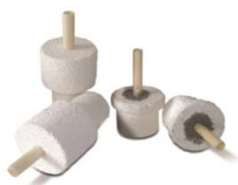
断熱セラミック製プラグ 標準アクセサリ 両端(炉心管長さ・内径に応じて製 作します)