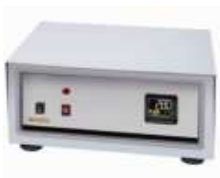
コンパクト制御ユニット (縦型の場合標準) (横型の場合はオプション) 写真中の制御器はE5CCを搭載しています。