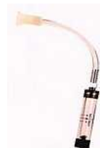
採集口でのスルーットを測定する流量計