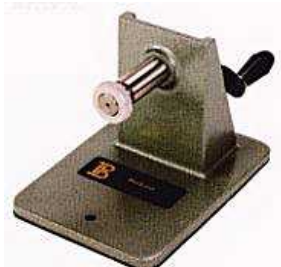
レコーディングドラム用ラボスタンド