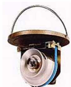
24時間ガラススライド採集用ふた