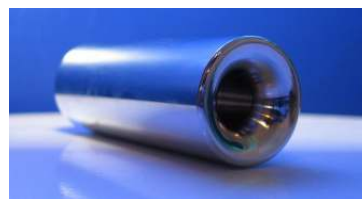
ドロップメッセンジャー