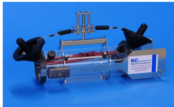
OSK 56LD103A, 2.0L