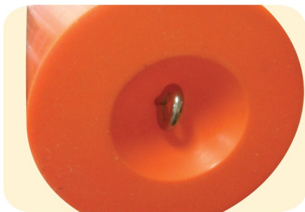
Recessed, stainless steel, anchor point means the buoy can stand upright when stored