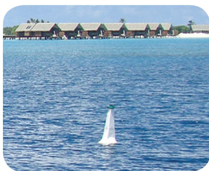
SL-B700 with SL-15 solar lantern, Maldives