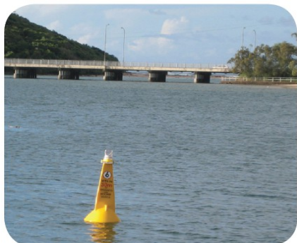
SL-B700 with SL-70 light installed in Victoria, Australia