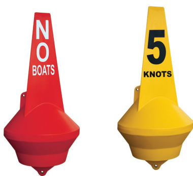
利用可能なオプションの金型のグラフィック