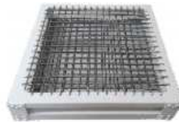
●スプリングラック