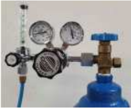
●CO2ガスレギュレータ