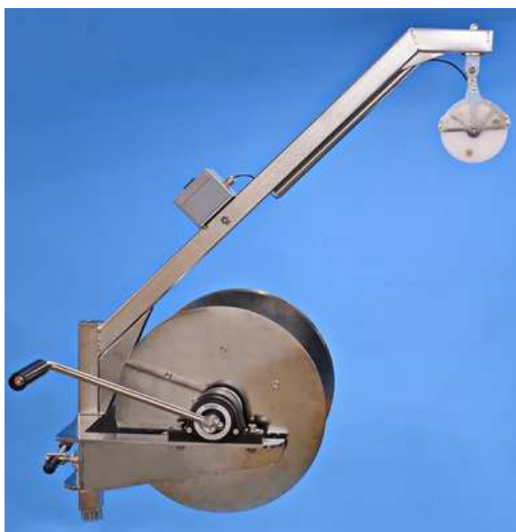
OSK 56LD551 写真はオプションを含みます

注：ウインチと一体化した部品であるため、ウインチを使用してギアを注文する必要があり、その後の取り付けは不可能でボートに取り付けるためのブラケットなしでもご購入可能です。