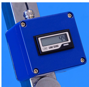
デジタルカウンタ(550のみ)