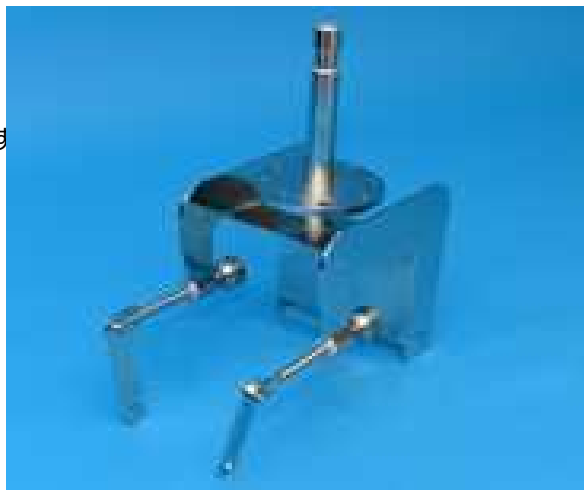
ボート取り付け用ブラケット