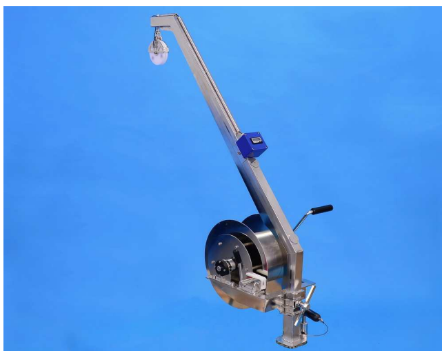
OSK 56LD550! 写真はオプションを含みます

手動式ウインチ、OSK56LD550はAISI 316ステンレス鋼製で、補強材が追加されています。