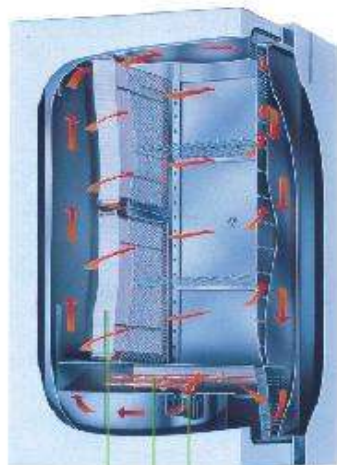
HEPAフィルター ヒーター 送風装置